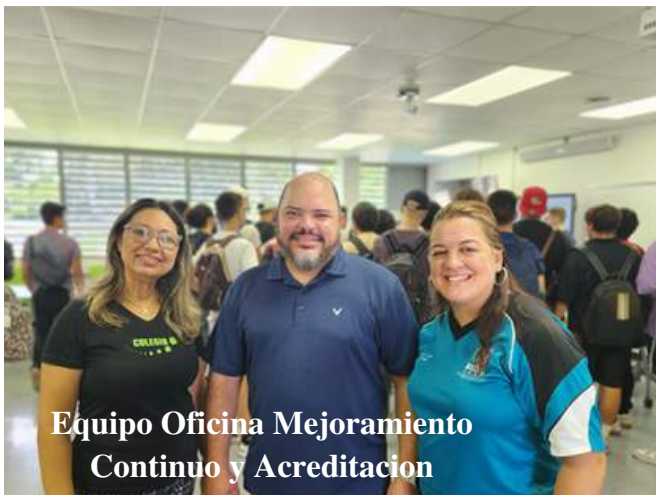
Equipo Oficina Mejoramiento Continuo y Acreditacion

Orientar a los estudiantes en las diferentes áreas de rutas y énfasis, oportunidades de empleo, programas graduados, investigaciones y proyectos, entre otros. Los estudiantes tienen la oportunidad de conversar y compartir experiencias tanto con profesores, estudiantes graduados y subgraduados